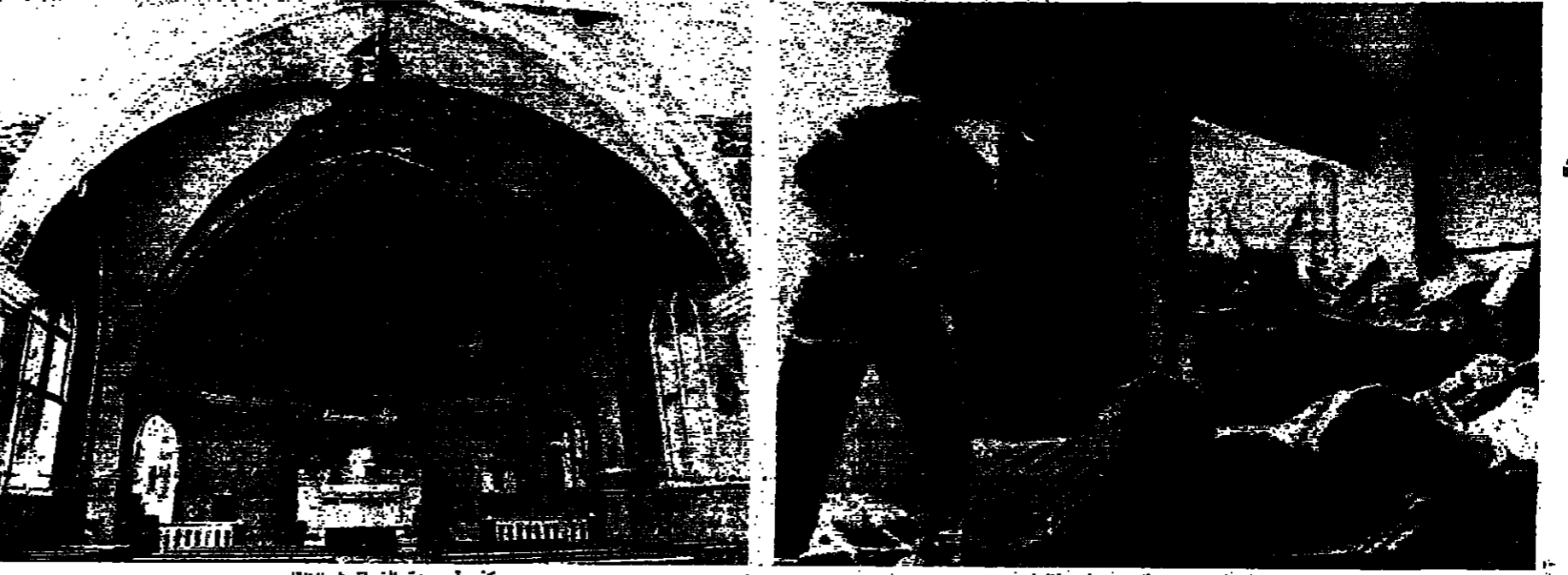
كنيسة سيدة الحقة في الرقلا